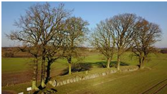
Luftbild der rekonstruierten Megalithanlage Karlsminde, Kreis Rendsburg-Eckernförde.

Mit Beginn der Neuzeit haben Megalithen zunehmend Interesse geweckt und bis heute ihren die Kulturlandschaft prägenden Stellenwert erhalten. Nach Aufgabe erfuhren Megalithen Umdeutungen und waren beliebte Objekte wissenschaftlicher Spekulationen. Dabei wurden Anlagen bereits im Mittelalter z. B. mit Kapellen überbaut oder Menhire, die inzwischen als Objekte der heidnischen Vorzeit erkannt waren, umgedeutet und ‚christianisiert‘. Die allergrößte Menge der teilweise mehr als 5000 Jahre alten Anlagen dürfte aber vor allem im späten 19. Jh. u. a. der Urbanisierung, Industrialisierung und dem Infrastrukturausbau zum Opfer gefallen sein. Steine wurden bspw. für den Haus-, Straßen- und Brückenbau genutzt. Außerdem dienten Megalithgräber vielfach auch als Sandentnahmestellen, da sie im Gegensatz zu heute ursprünglich von Erdhügeln bedeckt waren.